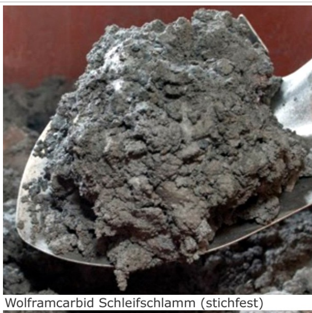
Wolframcarbid Schleifschlamm (stichfest)