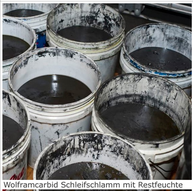
Wolframcarbid Schleifschlamm mit Restfeuchte