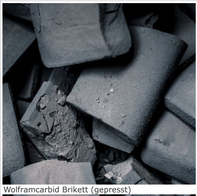
Wolframcarbid Brikett (gepresst)