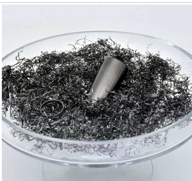
Tantalspäne (auch verölt)