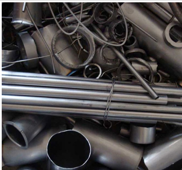
Tantal Schrotte und Abfälle