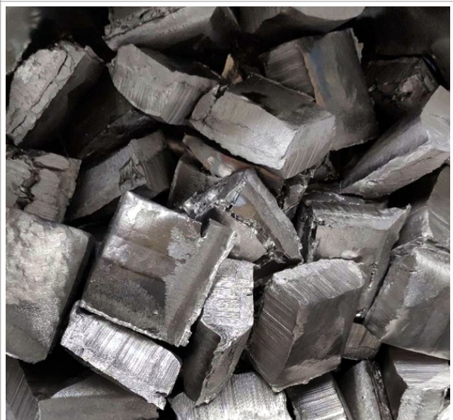
Niob Chunks & Lumps als Legierungsmetall