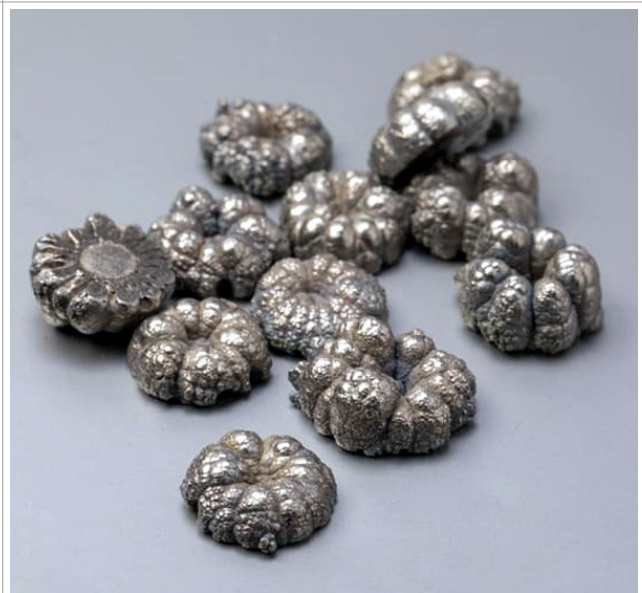
Elektrolytisches Nickel (Crowns)