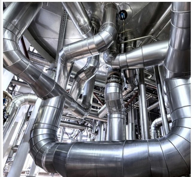
Nickel Rohre und Bleche