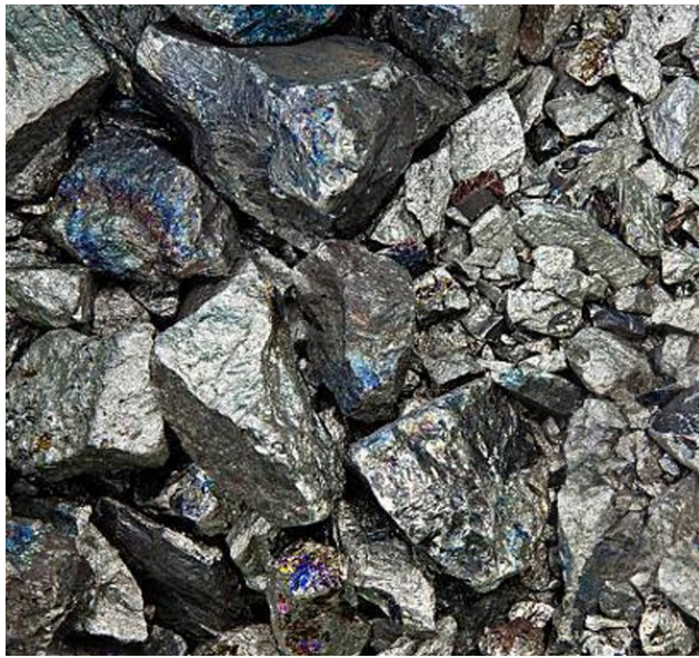
Nickel Lumps als Legierungsmetall