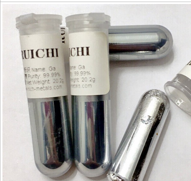
Gallium Ga4N 99,99%